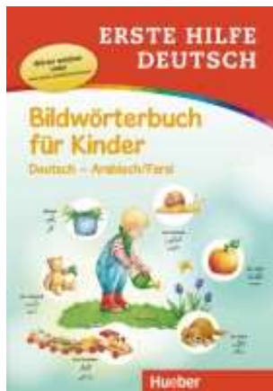
Erste Hilfe Deutsch : Bildwörterbuch für Kinder : Deutsch - Arabisch/Farsi. - München : Hueber, 2016. - 31 p. - ISBN 978-3-19-3631003-3